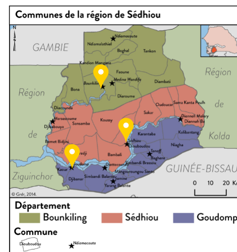
RÉGION DE SÉDHIYOU (CASAMANCE)