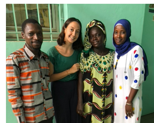
Dispensateur et médiatrices VIH du centre de santé de Sédhiou