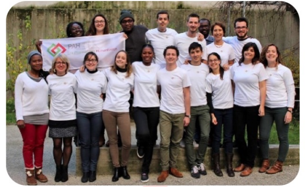
La Promo 2017-2018 « Les Canaris »