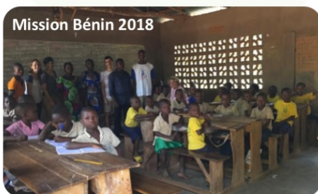
Mission Bénin 2018